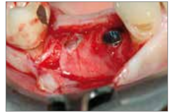
▲Abb. 4: Das eingebrachte Knochenersatzmaterial sechs Monate nach dem Eingriff: Die Kortikal-Membran bedeckt immer noch den Defekt.