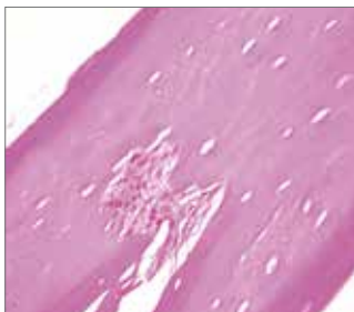
▲Abb. 1: Sechs Monate nach Einbringung: Es sind keinerlei Perforationen sichtbar – die Membran ist immer noch okklusiv.