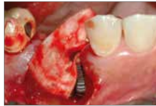
▲Abb. 2: Vor Auffüllung des Defekts wurde die Kortikal-Membran positioniert und mit der Schraubkappe des Implantats fixiert.