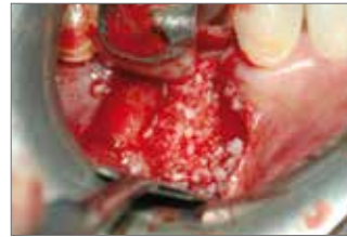
▲Abb. 3: Der Defekt wurde aus einem Mix von xenogenem (OX® Mix Gel) und autologem Material aufgefüllt und anschließend mit der Kortikal-Membran abgedeckt und speicheldicht verschlossen.