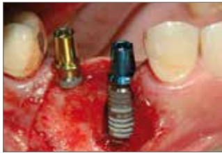
▲Abb. 1: Die beiden gesetzten Implantate sind primär stabil, die Gewindegänge des Implantats auf Position 25 sind allerdings stark exponiert.