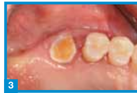
3 zwei Wochen Post-OP