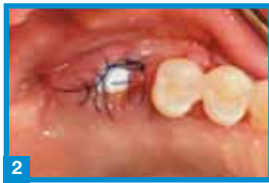
2 Fixation durch Naht