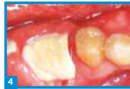
4 Exponierte OpenTex® Membran