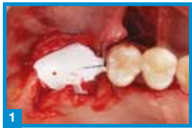
1 Positionierung der PTFE-Membran