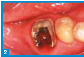
2 Situ vor der Extraktion