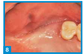
8 sechs Wochen Post-OP