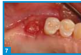
7 vier Wochen Post-OP