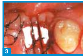
3 Abdeckung mit OpenTex® Membran Post-Op