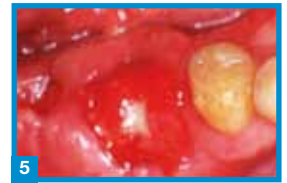
5 Situ fünf Wochen nach Entfernung