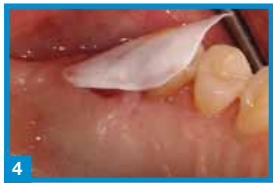
4 Einfache Entfernung der OpenTex®-Membran