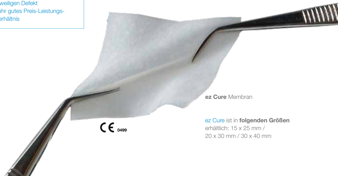
ez Cure Membran

Verarbeitung: Für eine optimale Handhabung sollte die ez Cure Membran vor dem Gebrauch mit steriler Kochsalzlösung für ca. ein bis zwei Minuten befeuchtet werden. Anschließend kann die Membran an den gewünschten Bereich appliziert werden. Um eventuelle Mikrobewegungen zu vermeiden, sollte die Membran mit resorbierbaren Pins oder Titan-Pins fixiert werden. Zudem sollte die Membran bzw. das augmentierte Areal mit entsprechender Naht speicheldicht und spannungsfrei verschlossen werden, um etwaige Risiken einer bakteriellen Kontamination zu vermeiden. Eine offene Einheilung wird bei Verwendung der ez Cure Membran nicht empfohlen.