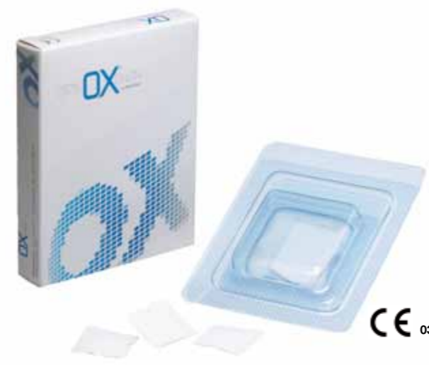
OX® Kortikal Lamina Membran

Die OX® Kortikal Membran ist in folgenden Größen erhältlich: 25 x 25 mm / 25 x 50 mm.